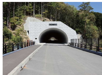
国道494号社会資本整備総合交付金 (水口トンネル)工事 田邊・轟・杉本 特定建設工事共同企業体