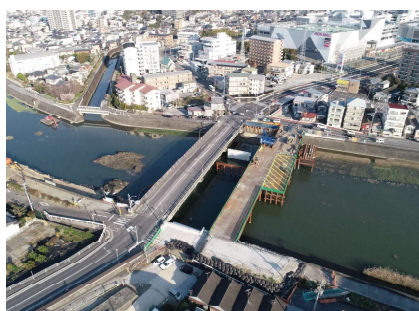
都市計画道路高知駅秦南町線 防災・安全社会資本整備交付金工事 入交建設 株式会社