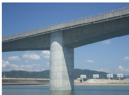
県道須崎仁ノ線防災・安全交付金 (仁淀川河口大橋)工事 株式会社 清水新星