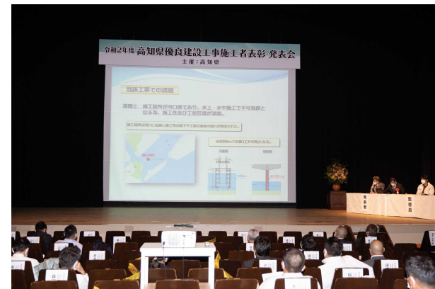
株式会社 清水新星