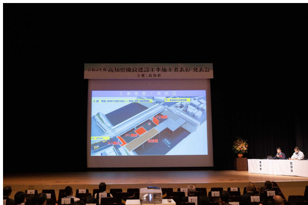
入交建設 株式会社