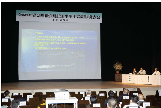
大旺新洋 株式会社 株式会社 三谷組