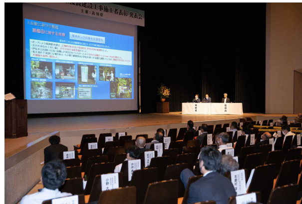
四国開発 株式会社