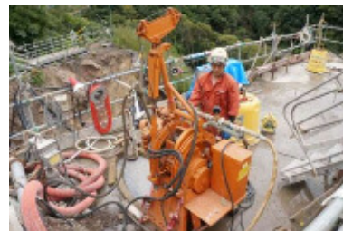
基礎処理作業状況

日ごろより、和食ダム事業へご理解とご協力いただき、ありがとうございます。 和食ダムは現在基礎処理工（貯水池の水がダムの底から漏れないよう地盤改良する工事）を行っています。 コンクリート打設は、左岸再掘削の準備のため、まだお休み中です。 その他関連工事として、和食ダム付替道路工事も現在進行中です。 今後もダム完成に向けてより一層頑張ってまいりますので、今後ともよろしくお願い致します。