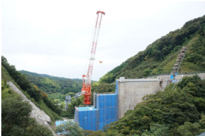
上流側からみた現在の和食ダム