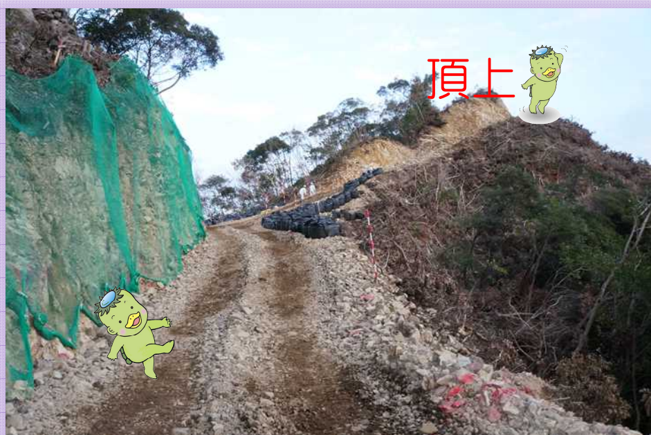
最大勾配約40%の工事用道路