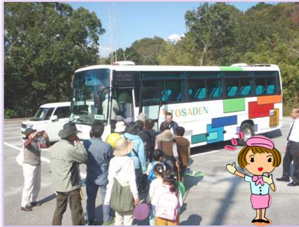
今年は少し大きめのバスで