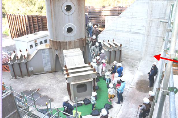
タワークレーンの足元