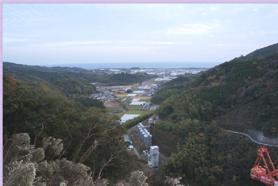
左岸頂上からの景色