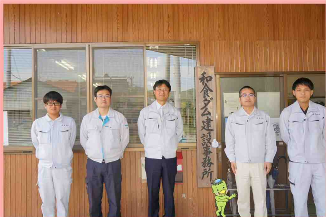
和食ダム建設事務所メンバー 集合写真

4月から関チーフを新たに迎え、和食ダム建設事務所の平成30年度がスタートしました。 今年度も地域住民の方々と共に、和食ダムの早期完成を目指し、安全第一に事業を進めて参りますので、皆様のご理解・ご協力をよろしくお願いします。