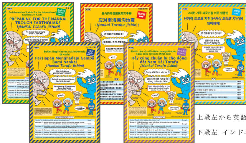
上段左から英語、中国語 (簡体字)、韓国語 下段左 インドネシア語、ベトナム語

南海トラフ地震対策パンフレット (5 か国語) ・ 携帯カード (6 か国語) ・ 高知市津波ハザードマップ (3 か国語) の配布