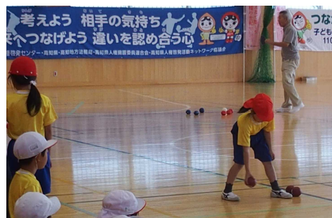
ポッチャ体験をする子どもたち

開催日：令和元年10月10日（木）、 令和2年1月21日（火） （2回開催） 参加者：延べ約206人