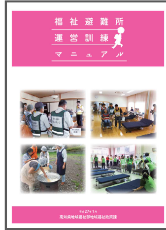
福祉避難所運営訓練マニュアル (平成 27 年 1 月)