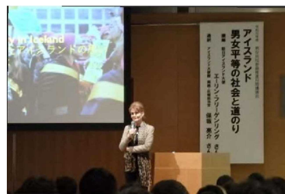
男女共同参画推進月間講演会