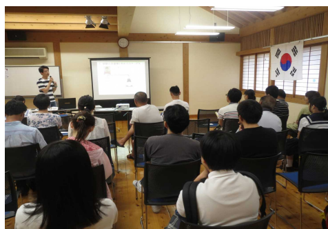
異文化理解講座（韓国）