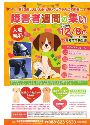
「障害者週間の集い」ポスター

開催日：令和元年12月8日（日） 「じんけんふれあいフェスタ」 と一緒に開催 来場者：約10,000人