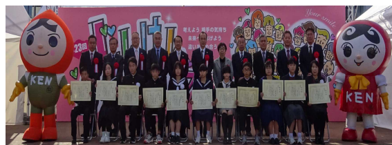
人権作文コンテスト表彰式

※ 法務局、人権啓発センター、県教育委員会との共催で行い、広報活動や啓発活動にも役立てています。