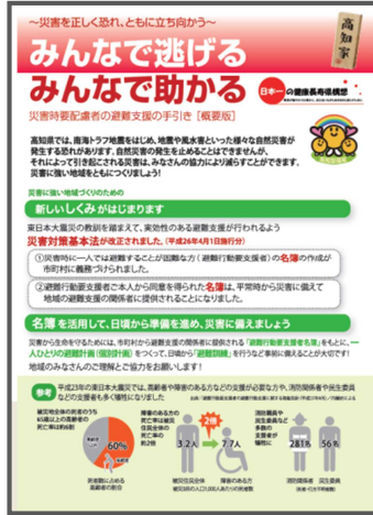
災害時要配慮者の避難支援の手引き (概要版) (平成 26 年 3 月)

災害時や災害後においても災害時要配慮者に対して人権に配慮した適切な対応が行えるよう、避難支援対策等の取組を推進しました。