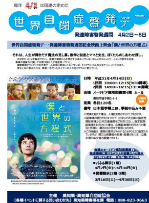
「僕と世界の方程式」上映会チラシ

映画上映：「僕と世界の方程式」 共催者：高知県自閉症協会 上映日：平成31年4月14日（日） 参加者：103人