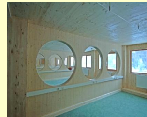
イタリア トリノ トリノオリンピック 記者・ボランティア用宿泊施設 2006年完成 4階建・4棟