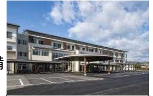
療育福祉センター・中央児童相談所

子どもに関する相談機能を担う両機関が総合的な施設として、それぞれの機能を連携させ、より効果的な支援を行っていくために機能を集約し、一体的に整備