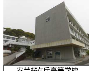
安芸桜ヶ丘高等学校

安芸中学校・高等学校と安芸桜ヶ丘高等学校との統合に伴う、安芸桜ヶ丘高等学校の既存校舎の長寿命化改修を実施