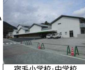
宿毛小学校・中学校

市の小学校及び中学校は、浸水区域に位置しているため、防災の観点で児童生徒が安心して過ごせる学校教育施設の形成を目指し、新校舎等の施設整備を実施