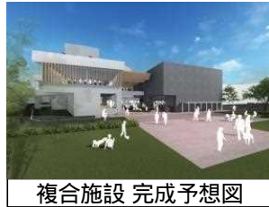
複合施設 完成予想図

老朽化した公共施設（文化センター・中央公民館・働く婦人の家）について、各施設を集約化・再配置する文化複合施設の整備を実施