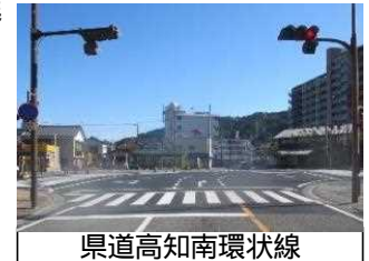
県道高知南環状線

【事業費】 1,965百万円 【対象箇所・事業期間】 県道高知南環状線ほか55路線（H30～R2）