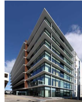
香南市庁舎(7階建て) 耐震壁にCLTを使用

都市の脱炭素化 には、鉄やコンクリートと比較して製造時の炭素放出量が少なく、素材自体の炭素固定量が多い木材を活用して、 中高層建築物の木造化・木質化 を進めることが必要 木造建築を進めるためには、 人々の目に見える形で事例を積み上げ 、その良さを示すとともに、メリットやコスト、耐久性などの情報を分かり易く提供することが必要 木造建築物は、法定耐用年数が短いことなどから 資産価値が低く評価される ケースがあるが、 環境面と経済的な価値をあわせて評価 することが必要