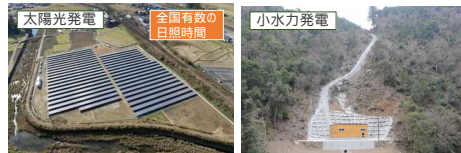
こうち・さかわメガソーラー発電所