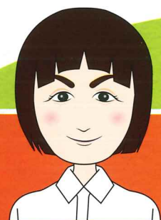
トータルアドバイザー

トータルアドバイザーは、医療的ケア児等コーディネーターへの助言やサポートを行うほか、ご家族からの相談や、支援機関からの相談に応じます。