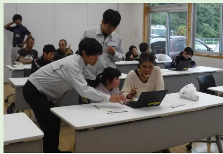
土砂災害警戒区域確認