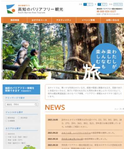
「高知のバリアフリー観光ウェブサイト」PV数