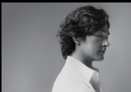
総合演出 村松 亮太郎