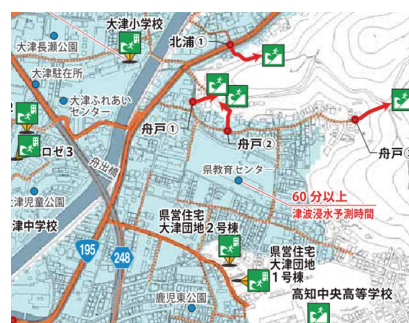
高知市津波避難マップ「大津小学校区」 第2版(令和元年12月)より