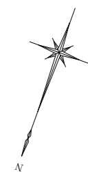
計画平面図(2) S=1:1000 供用開始図