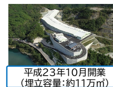
平成23年10月開業 (埋立容量:約11万 3 m)