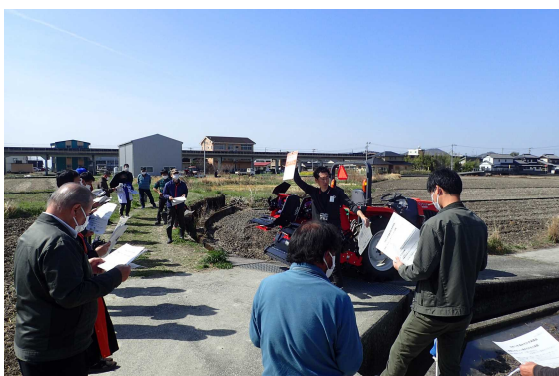
浅水代かきの実践①