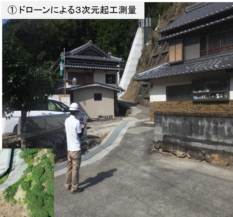
① ドローンによる3次元起工測量