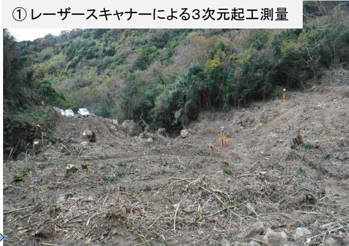
① レーザースキャナーによる3次元起工測量