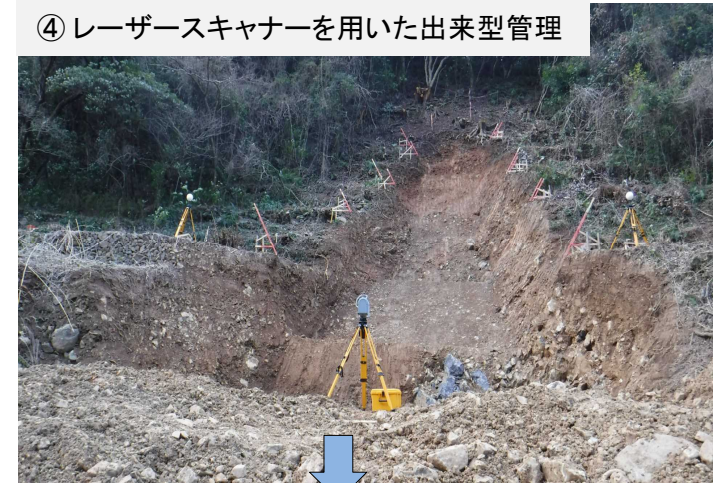
④ レーザースキャナーを用いた出来型管理