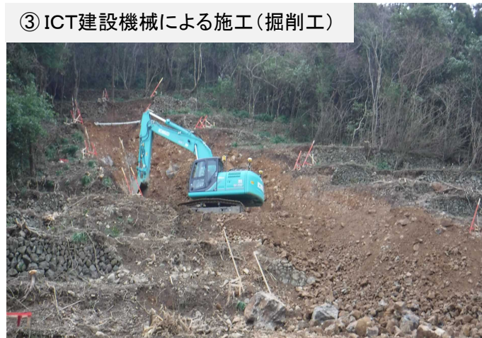
③ ICT建設機械による施工(掘削工)