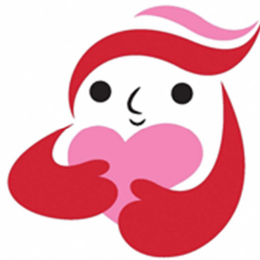
犯罪被害者等支援シンボルマーク 「ギョットちゃん」