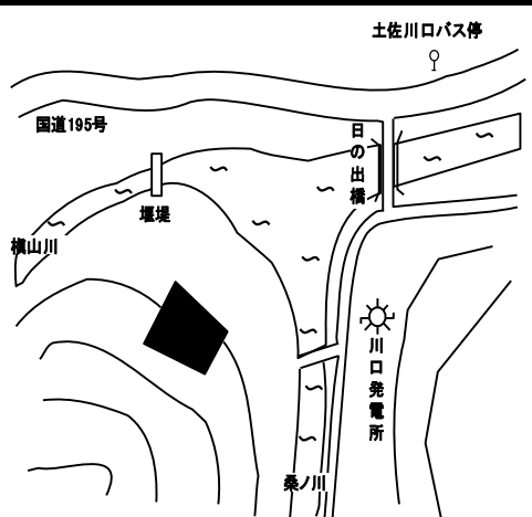
JR土佐山田駅の北東方約33km