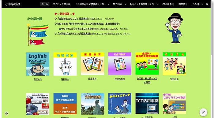
<教職員ポータルサイト 小中学校課トップページ>

小中学校課のサイトでは、各教科等の指導ツールから ICT 活用事例、コミュニティ・スクール、学校図書館といった学校教育全般にわたる情報を掲載しています。