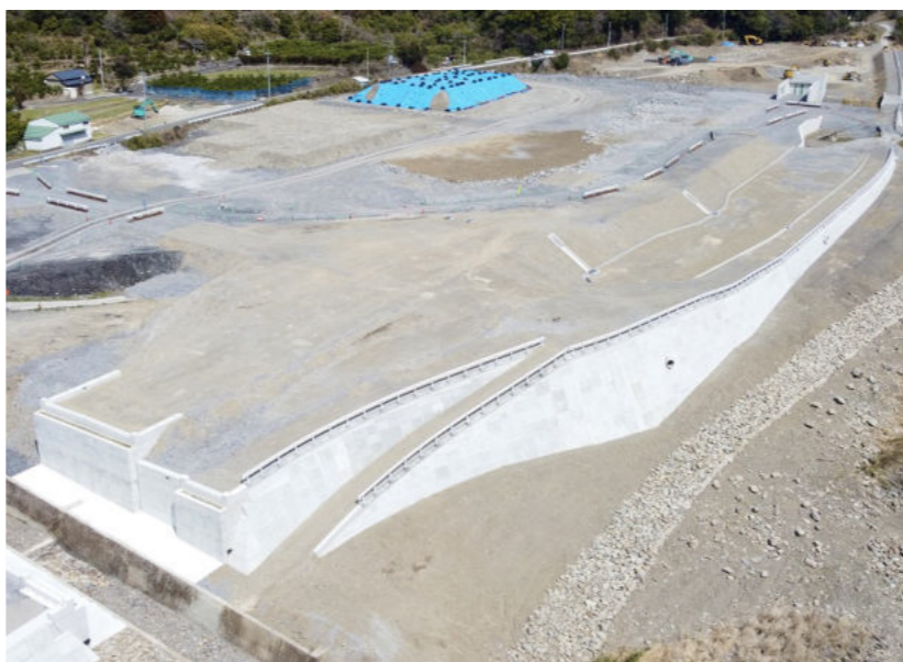
国道493号(北川道路)道路改築工事