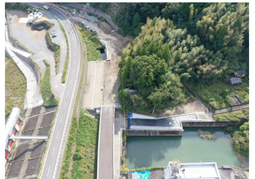
県道土佐伊野線 防災・安全交付金工事