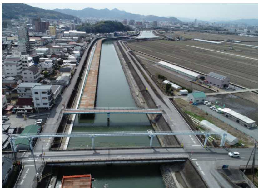
舟入川事業間連携工事