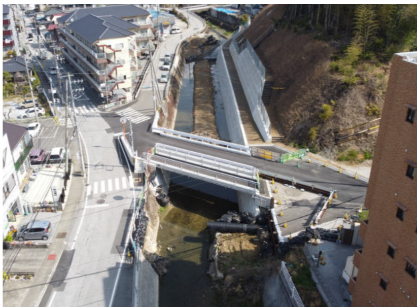
志奈祢川 3か年緊急対策工事

このオンライン発表会は、 一般社団法人 全国土木施工管理 技士会連合会 CPDS(継続学習)の 認定講習となります。