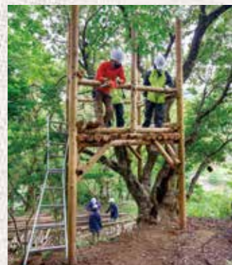
初夏になれば甘酸っぱい実をつけるやまももの樹が、ツリーハウスのシンボルに

高知県立森林研修センター情報交流館 香美市土佐山田町大平80番地 TEL 0887-52-0087 https://www.k-kouryu.net/