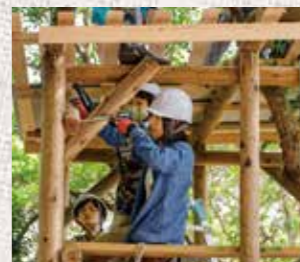
「いつか庭に作って子どもを遊ばせたい」と夢見る参加者