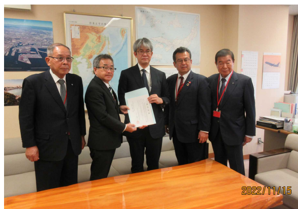
国土交通省 大臣官房 加藤技術総括審議官