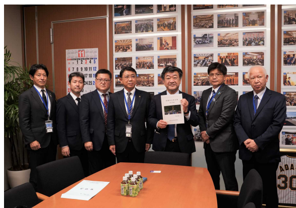
参議院 足立敏之議員