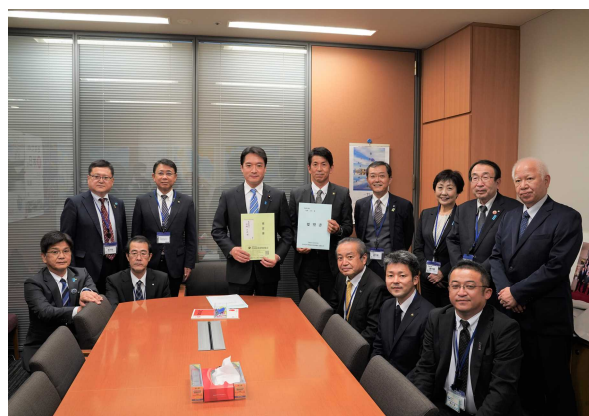
衆議院 尾崎正直議員