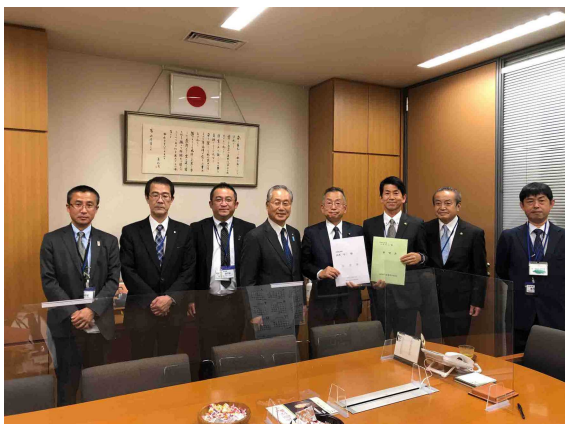
衆議院 山本有二議員