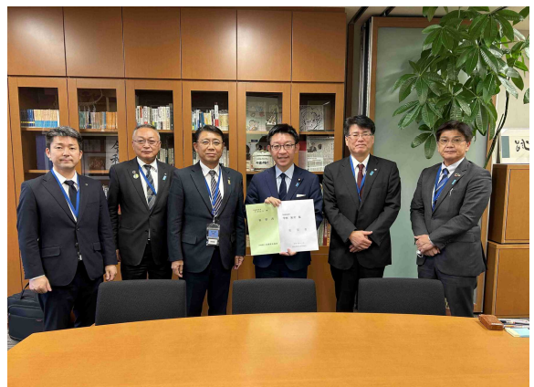
参議院 中西祐介議員