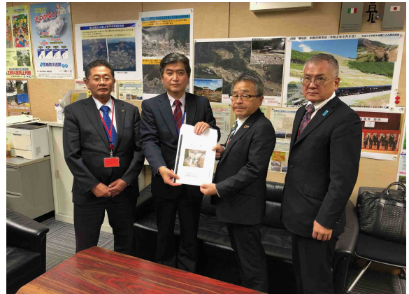
国土交通省 水管理・国土保全局 三上砂防部長