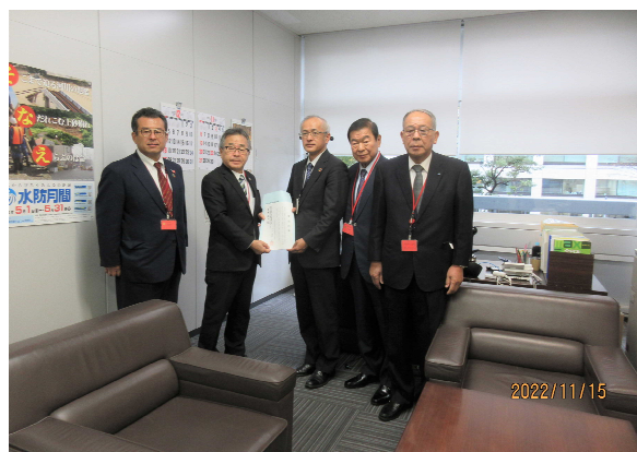
国土交通省 草野大臣官房審議官