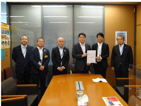
衆議院 尾崎正直議員