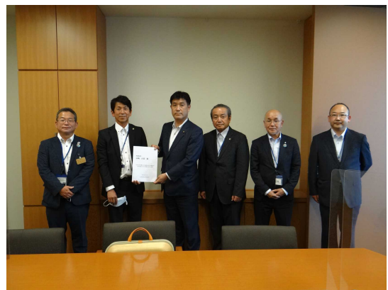
衆議院 山崎正恭議員