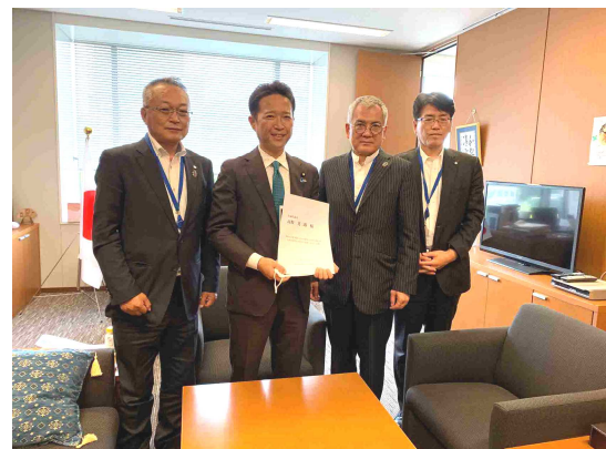
参議院 高野光二郎議員