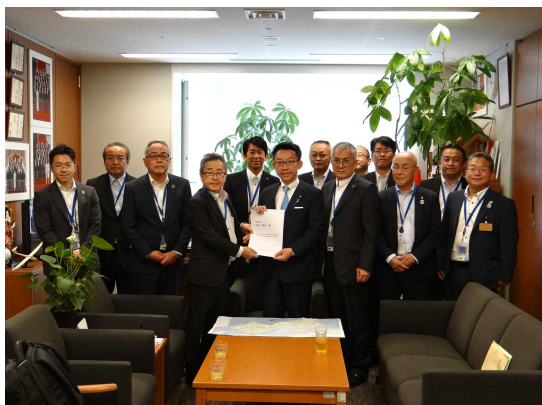
参議院 中西祐介議員