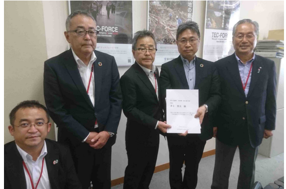
国土交通省 水管理・国土保全局 井上局長