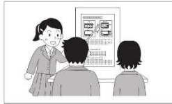
ポスターを使った発表