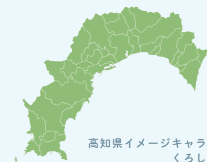
高知県イメージキャラクター くろしおくん