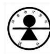
(b) 特別用途食品の標識

以上に述べた(a) 保健機能食品、(a)① 特定保健用食品、(a)② 栄養機能食品、(a)③機能性表示食品、(b)特別用途食品（特定保健用食品を除く。）の規制上の関係を図示すると次表のとおりとなる。