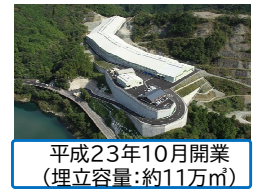
平成23年10月開業 (埋立容量:約11万 3 m)