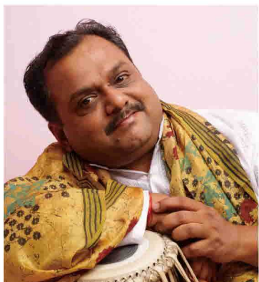
パンディット・プロセンジット・ポダル (北インド古典音楽 タブラ奏者) Pt. Prosenjit Poddar (Tabla)

シタール奏者だった父ラダ・クリシュナ・ポダルの影響で、5歳でタブラを始める。インド人間国宝パドマブーシャン・ビシュワ・モハンバット(ビーナ奏者)など、巨匠と多く共演。USA、ヨーロッパ、カナダなど世界中で公演やワークショップを開催。