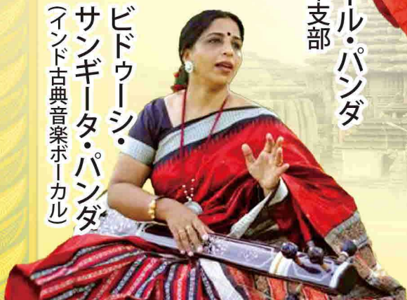
ビドゥーシ・サンギーター・パンダ (インド古典音楽ボーカル)