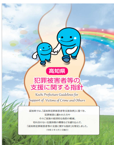
高知県犯罪被害者等の支援に関する指針 (リーフレット)