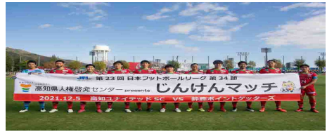
冠協賛試合（高知ユナイテッドSC vs 鈴鹿ポイントゲッターズ）