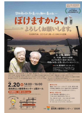
映画「ぼけますから、よろしくお願ひします。」上映会チラシ

映画「ぼけますから、よろしくお願ひします。」 上映会 開催日：令和4年2月20日（日） 参加者：106人