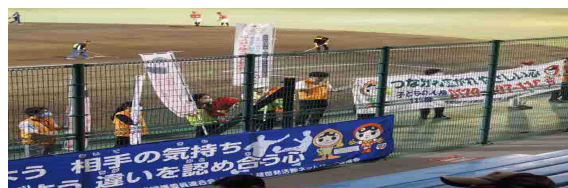
冠協賛試合(高知ファイティングドッグスvs徳島インディゴソックス)

内容：球場入り口付近で着ぐるみでの人権啓発、観客席のスペースで人権啓発横断幕とのぼり旗を掲げPR、人権啓発物品の配布等