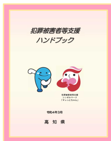
犯罪被害者等支援ハンドブック (令和4年3月改訂)