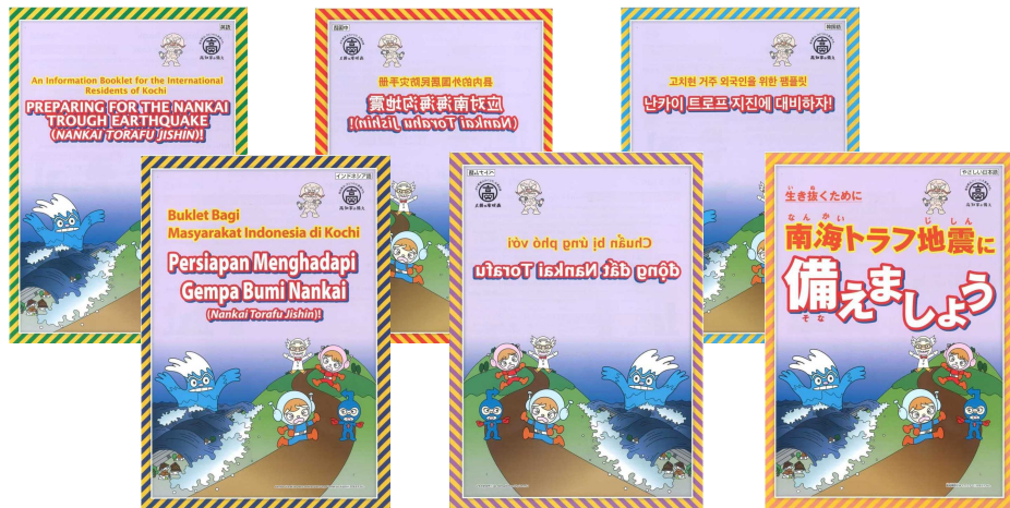
上段左から英語、中国語（簡体字）、韓国語 下段左からインドネシア語、ベトナム語、 やさしい日本語