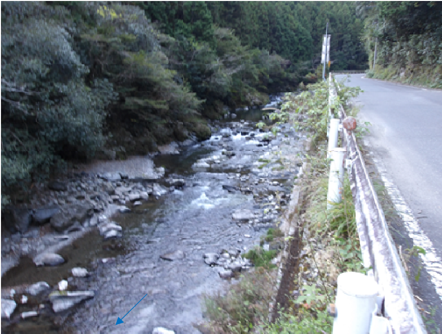
（桐見ダム上流状況）