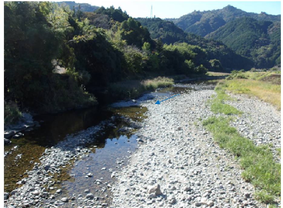
（桐見ダム下流状況）