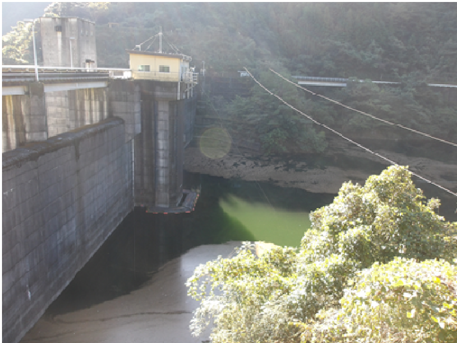
（桐見ダム直上流状況）