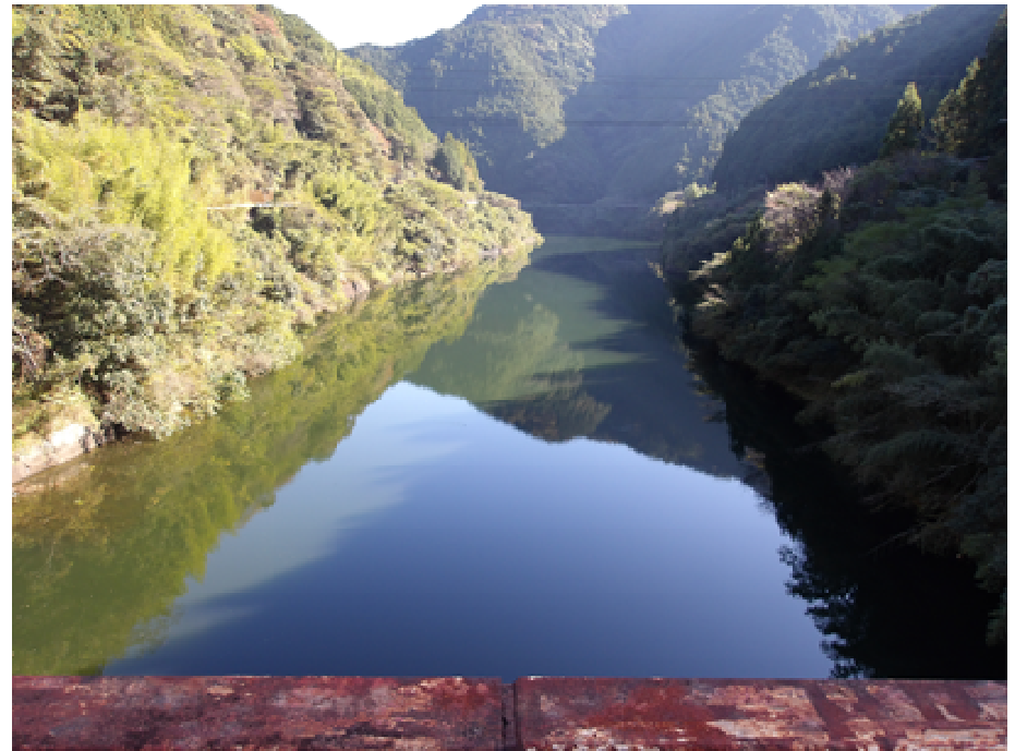
（桐見ダム貯水池状況）