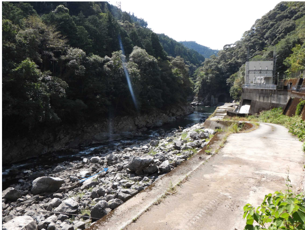
貯水池上流端状況 R5.10.18