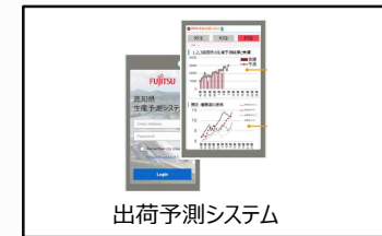
出荷予測システム