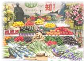
「園芸品の販売拡大」