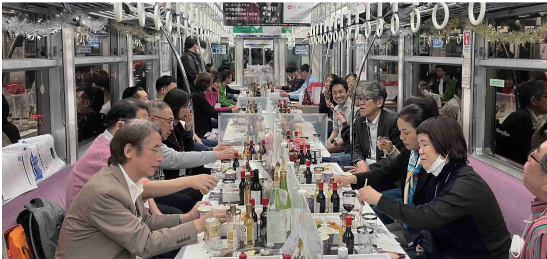
イベント列車開催時の様子