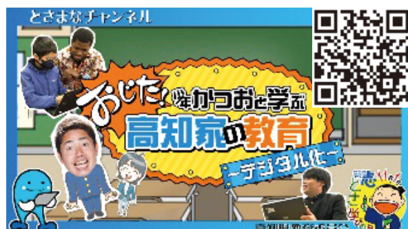
↑「おじた！少年かつおと学ぶ高知家の教育 ~デジタル化~」説明動画