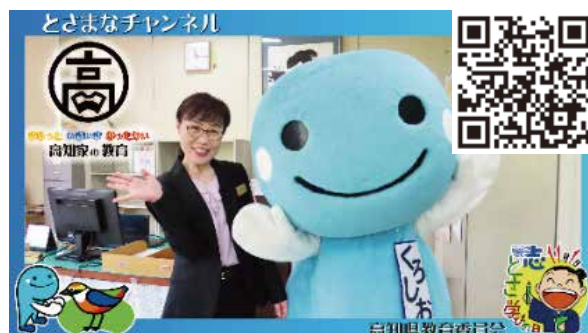
↑「とさまなチャンネル」紹介動画