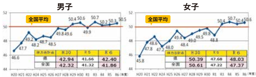
全国体力・運動能力等調査結果（8種目の総合点・中学2年生）