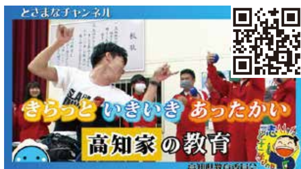
↑「『きらっといきいき あったかい』 高知家の教育」説明動画

★高知県の特色ある教育施策や学校の取組、子どもたちのがんばる姿、幼児教育の大切さ、教職の魅力などを発信していきます。