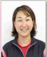
みき さとみ 三木 聖美氏 元バスケットボール選手 元日本代表