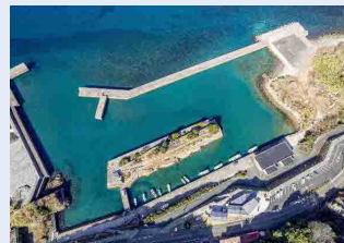
利用の低下した水域施設や用地