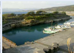
河野公園（石積堤、漁港環境施設）