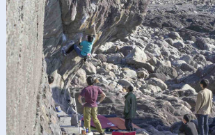
大山岬公園周辺（ボルダリング）