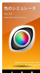
<色弱者への配慮、活用できるアプリの紹介>