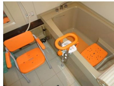
<便利グッズ・福祉用具の活用法>