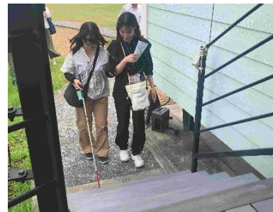
<視覚障害者の介助体験>