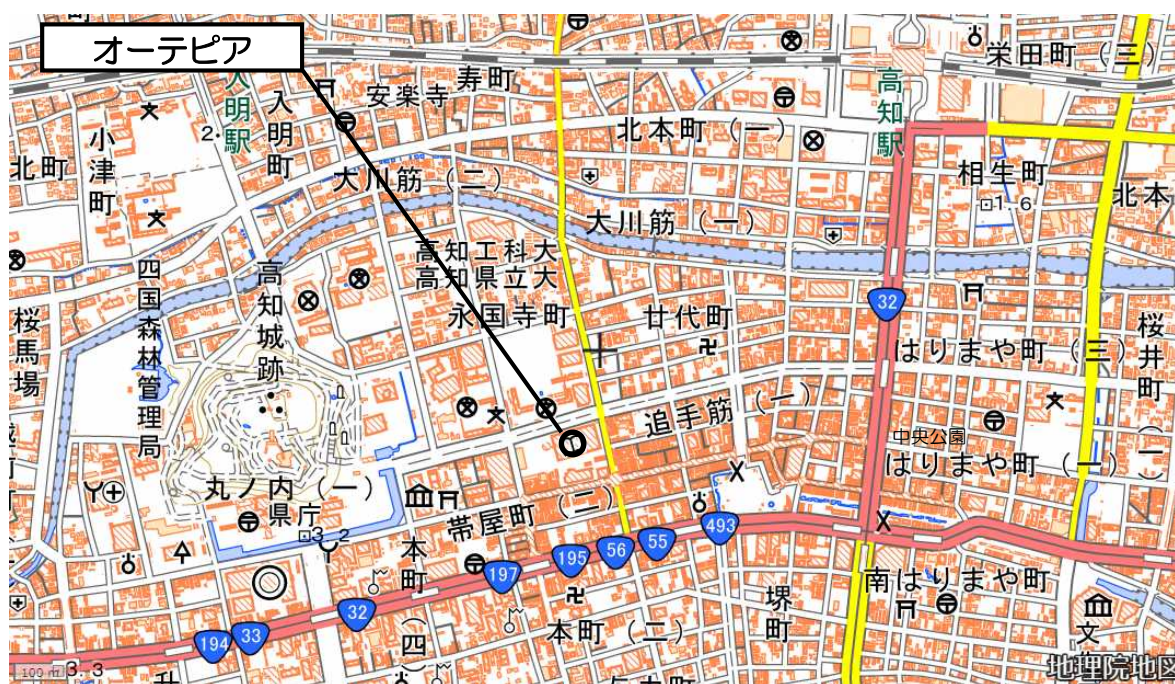
電子地形図 25000(国土地理院)を加工して作成