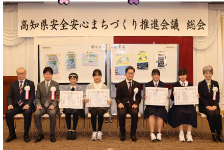
ポスター表彰式での記念写真撮影の様子

この作品は、カギを閉め忘れたら、どろぼうなど、だれかが入ってきてしまい、大事な物などがぬすまれました。うかもしれないという作品にしました。足あとには、どろぼうの足あとです。