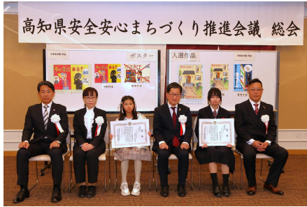
ポスター表彰式での記念写真撮影の様子