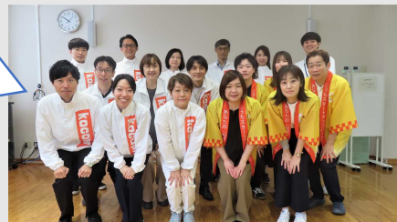
(産業イノベーション課の職員)

高知県産学官民連携センターにて勤務していただきます。 ご応募お待ちしております！