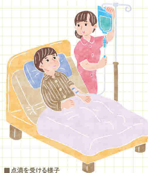
■点滴を受ける様子

腕の細い血管から点滴する末梢静脈栄養と心臓の近くまでカテーテルを通して点滴する中心静脈栄養があり、中心静脈栄養では1000kcal以上の高カロリー点滴が可能です。中心静脈栄養に使用するカテーテルは、局所麻酔での手術で日帰り～1泊2日で造設可能です。ただし血管内にカテーテルが長期間入ることで感染症を起こすリスクがあります。神経難病患者では飲み込むことは難しくても、腸管は問題なく動いているため、点滴ではなく胃ろうや経鼻胃管が推奨されています。