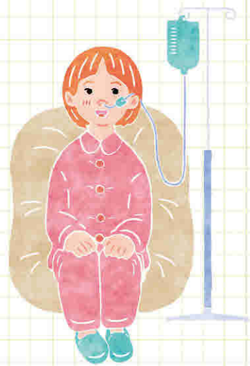
■鼻から栄養をとる様子

鼻から胃まで細長い管を通し、胃の中に直接、食事や水分、栄養剤などを入れる方法です。手術は必要なく、呼吸状態を問わずいつでも入れられます。ただし抜き差しはせずに入れたままにしておくため、誤って抜けないように注意が必要です。また喉の違和感や見た目が気になることがあります。