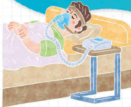
■マスク型人工呼吸器を付けて眠る様子

自身で付け外しできるマスク型の人工呼吸器です。息を吸ったタイミングで、機械が空気を入れるため、深く呼吸ができます。夜寝る時に付けることが一般的ですが、日中つけることもあります。痰や唾液が多い時、喉の力が落ちている時は、窒息のリスクがあるため使用できないことがあります。