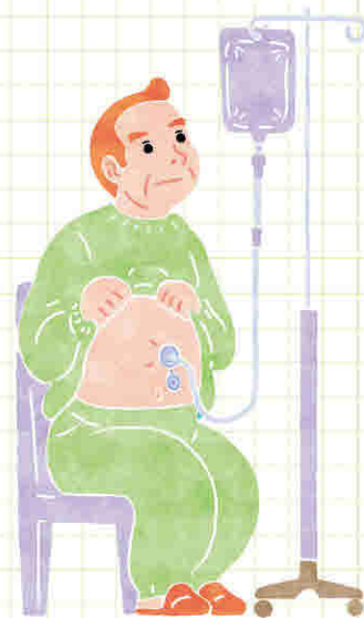
■お腹から栄養をとる様子

一般の方でも簡単に管理、取扱いでき、チューブは服の下に隠れるため見た目が気になりません。多くの場合、胃カメラを使用して30分以内で造れますが、抜糸も含めて約1-2週間の入院が必要です。ただし呼吸状態や以前の手術歴によっては、造ることをお勧めできないことがあります。