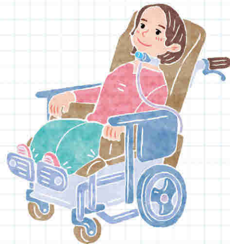
■喉へ人工呼吸器を付けて日常を過ごす様子

喉に穴を開けて、人工呼吸器をつなぐ状態です。機械が呼吸をサポートし、痰の吸引も簡単になるために症状が緩和されます。ALS患者さんの生存期間を約6.7年延長します。一方で、会話できなくなり、TIV後も全身の症状が進むとコミュニケーションが難しくなること、希望時に呼吸器を外せないことが問題となります。