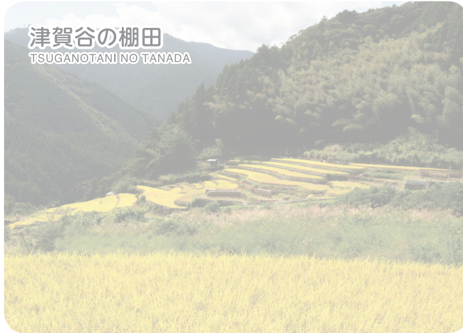
津賀谷の棚田 TSUGANOTANI NO TANADA