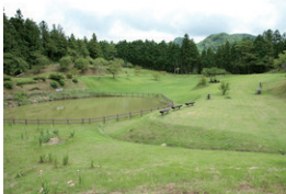
■星ヶ窪キャンプ場

棚田のすぐ目の前には樹齢1,200年の大銀杏があり、県の指定天然記念物にも指定されています。また長者地区の山頂部には、隕石が落ちた跡と言われる「星の池」が中央にあるキャンプ場もあります。