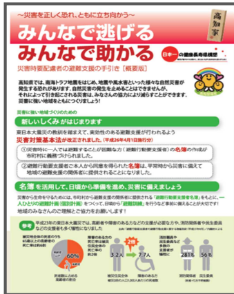
災害時要配慮者の避難支援の手引き （概要版）（平成 26 年 3 月）