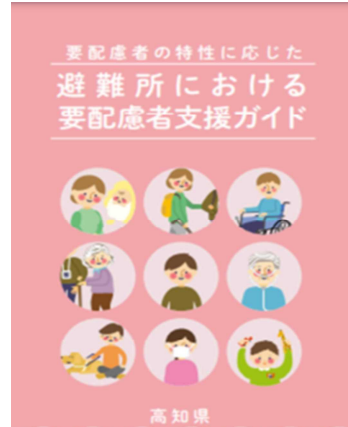
避難所における要配慮者支援ガイド （令和 2 年 8 月）