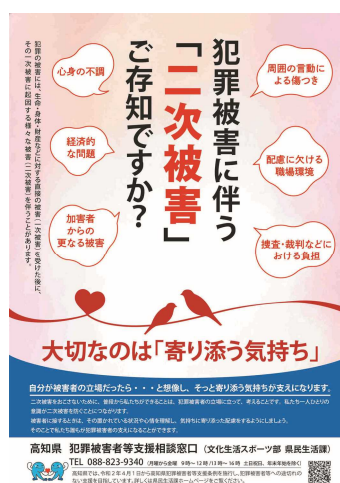
二次被害防止に係るポスター