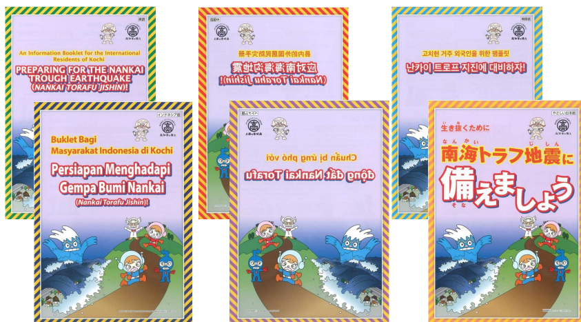
上段左から英語、中国語（簡体字）、韓国語 下段左からインドネシア語、ベトナム語、やさしい日本語

南海トラフ地震対策パンフレット（5 か国語、やさしい日本語）・携帯カード（6 か国語）・高知市津波ハザードマップ（3 か国語）の配布