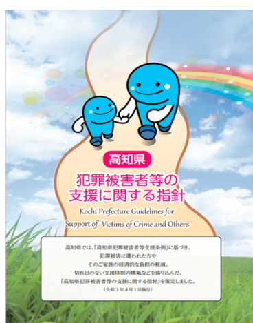
高知県犯罪被害者等の支援に関する指針 （リーフレット） （令和3年4月）