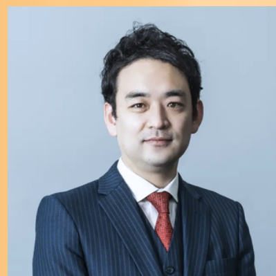
株式会社船井総合研究所 100億企業化ロードマップ推進部 マネージングディレクター