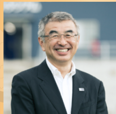
株式会社ありがとうサービス 代表取締役最終経営責任者