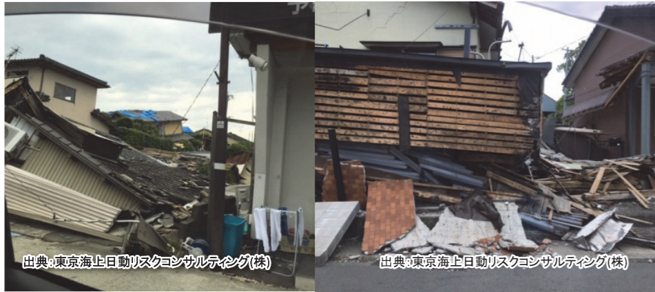
【熊本地震の建物被害】