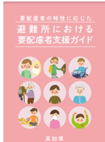
避難所における要配慮者支援ガイド (令和 2 年 8 月)