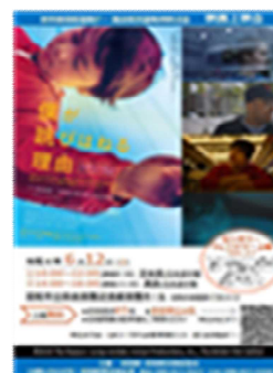
映画「僕が跳びはねる理由」 上映会チラシ