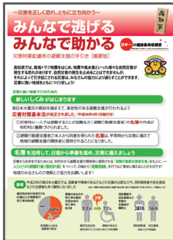
災害時要配慮者の避難支援の手引き (概要版) (平成 26 年 3 月)

災害時や災害後においても災害時要配慮者に対して人権に配慮した適切な対応が行えるよう、要配慮者対策を推進しました。