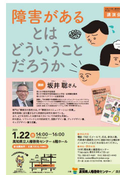
講演会「障害があるとはどういうことだろうか」チラシ