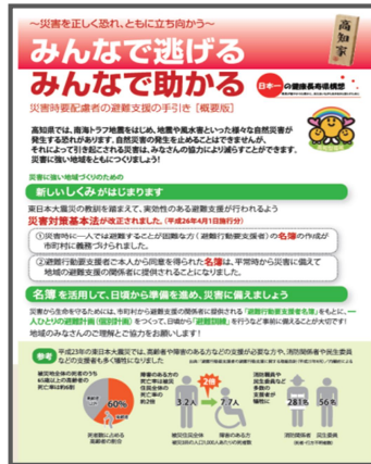
災害時要配慮者の避難支援の手引き （概要版）（平成 26 年 3 月）